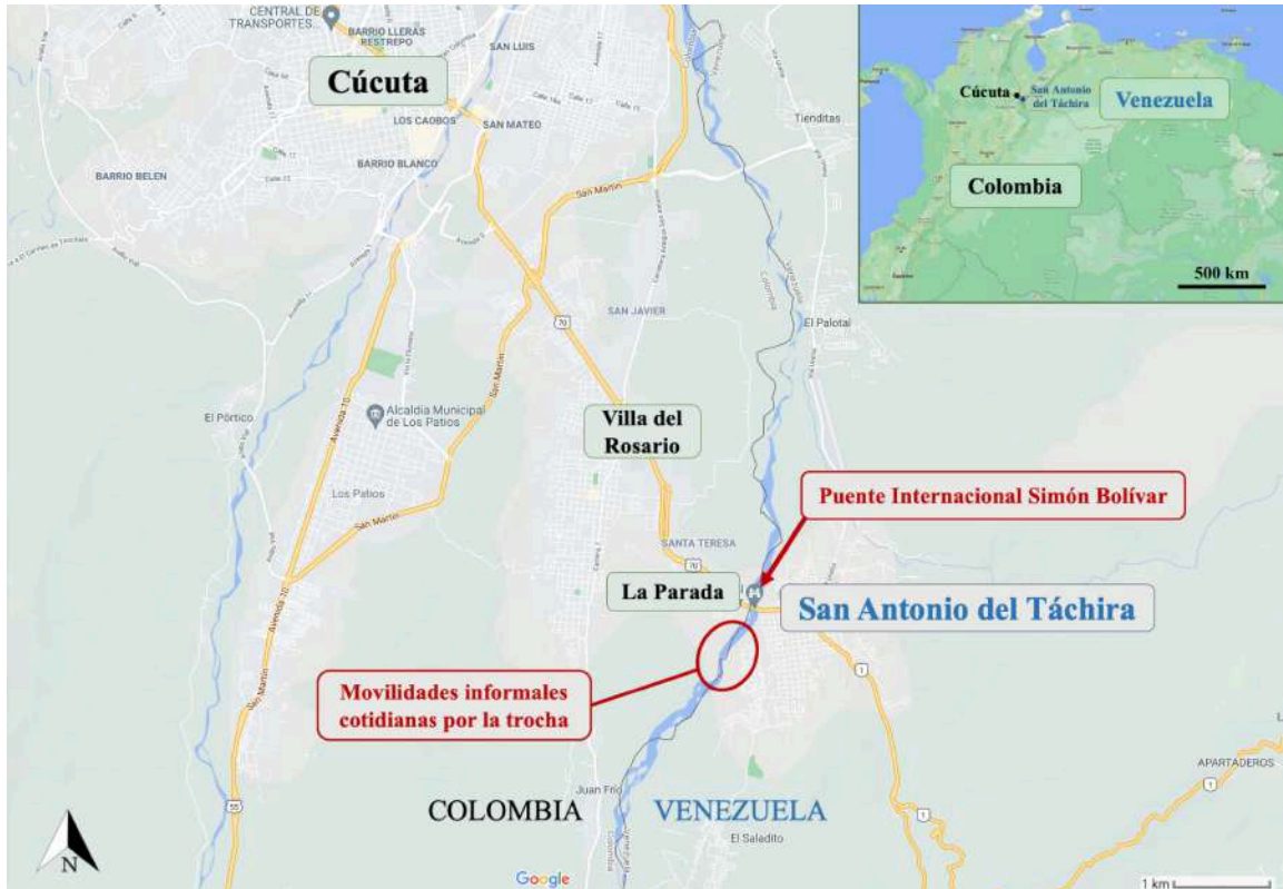
Mapa 1. Lugares del trabajo de campo multisituado en la zona limítrofe entre Cúcuta y su área metropolitana (Colombia) y San Antonio del Táchira (Venezuela)