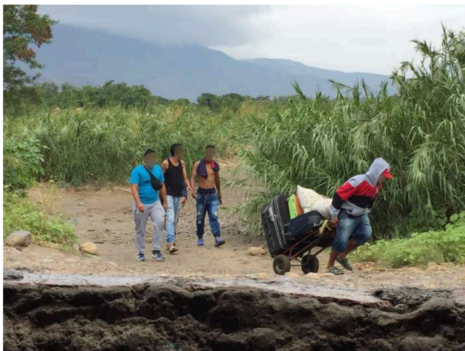
Fotografía 2. Movilidades informales de personas, bienes y capitales a través de la trocha entre Colombia y Venezuela