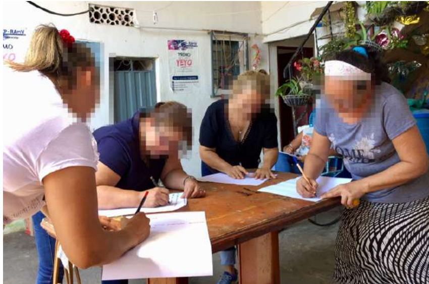
Fotografía 1. Taller participativo Minga donde mujeres en retorno diseñan mapas mentales sobre sus sueños de reintegración